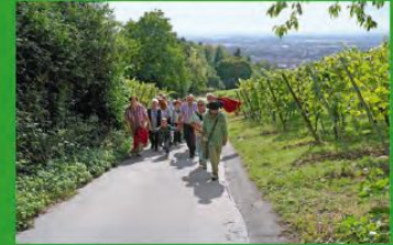
15-Jährige Franziskanischer Pilgerweg in Bensheim (2002-2017)

...“So lasst uns aufbrechen und immer wieder neu beginnen“...