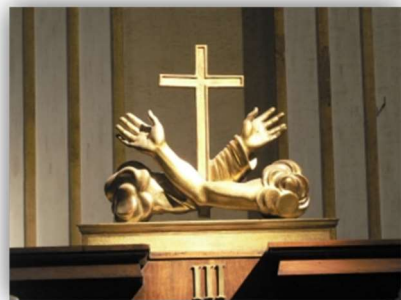
Franciskanisches Ordenswappen auf einem Beichtstuhl in Rom

daher gegenüber dem Papst leben muss, wird an vielen weiteren Stellen in den Schriften des heiligen Ordensgründers wiederholt, weil sie wichtig und entscheidend ist.